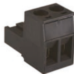
G-106-735 ターミナルブロック